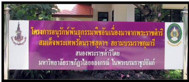
โครงการอนุรักษ์พันธุกรรมพืชอันเนื่องมาจากพระราชดำริ