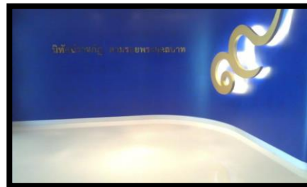
หอเฉลิมพระเกียรติ “นิตศันราชภัฏ”