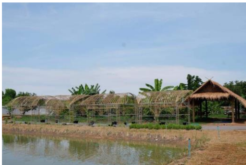
ฐานความมั่นคงด้านอาหาร

จุดประสงค์การพัฒนาศูนย์การเรียนรู้ของสำนักส่งเสริมการเรียนรู้และบริการวิชาการ เพื่อให้ นักศึกษา อาจารย์ บุคลากร และประชาชนทั่วไป สามารถเข้ามาศึกษาหาความรู้ เพิ่มพูนทักษะด้านต่างๆ จาก การปฏิบัติจริงนอกห้องเรียน แลกเปลี่ยนประสบการณ์ ในการแก้ไขปัญหาชุมชนท้องถิ่น เป็นแหล่งรวบรวมองค์ความรู้ ในการถ่ายทอด เผยแพร่ ให้กับผู้เข้ามาศึกษาดูงาน สามารถกลับไปใช้ในแก้ปัญหาของชุมชนได้อย่างแท้จริง