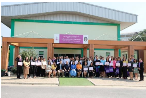
ศูนย์ประสานงานโครงการอนุรักษ์พันธุกรรมพืช