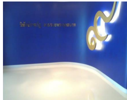
หอเฉลิมพระเกียรติ “นิทัศน์ราชภัฏ”