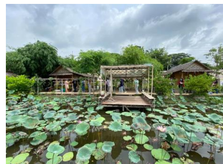
บ้านชีวิที